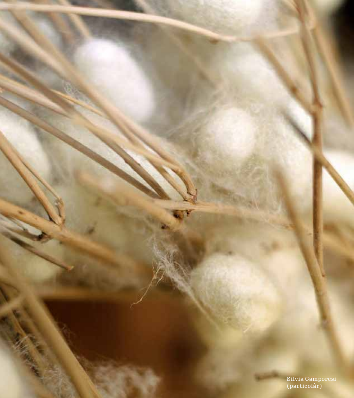
Silvia Camporesi (particolâr)